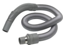
Flexibilní hadice 1-6 m Obj. číslo: 42000122

A především, bezdrátový přenos má tu úžasnou vlastnost, že umožňuje obousměrnou komunikaci mezi agregátem a uživatelem. Běžně je vysavač napájen z elektrické sítě a k zapnutí dojde, jakmile zasunete hadici do zásuvky. A opačně, jakmile odpojíte hadici, vysavač se okamžitě vypíná. S bezdrátovým centrálním vysavačem si můžete volit ovládání a kontrolu všech funkcí - ZAP / VYP, sílu sacího výkonu, stav prachového sáčku, atd. – a vše se přenáší přímo na displej na rukojeti vaší hadice. Nicméně, vše závisí na typu příslušenství, které si vyberete. Nilfisk nabízí více typů, určených pro bezdrátovou komunikaci. Jeden komunikuje pomocí LED diod a druhý LCD displejem.