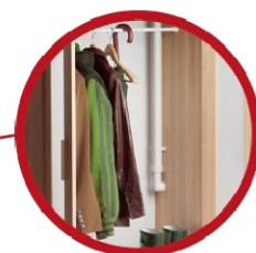
Instalace rozvodů ve skříní