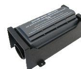
HEPA filtru Obj. číslo: 42000480