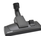
Kombi hubice Obj. číslo: 42000142